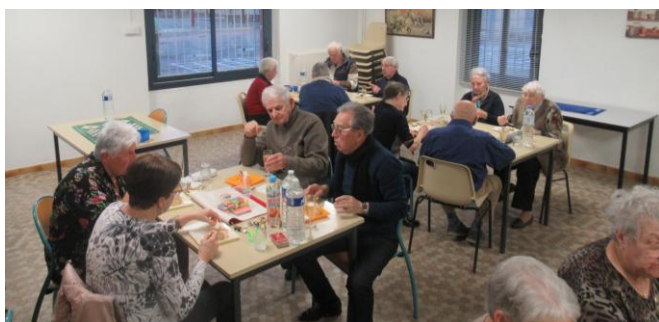
La bûche de Noël des Amis du Rayon d'Or le 23 décembre