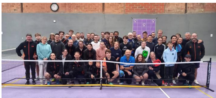
Le 1 er tournoi de pickleball le 14 décembre par le Tennis Club Beausemblant