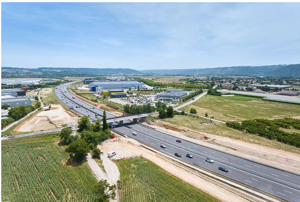
Vue aérienne du pont de la RD 1 franchissant l'A7

VINCI Autoroutes poursuit le chantier de création des demi-échangeurs de Porte de DrômArdèche, entre Chanas et Tain-l'Hermitage. Dans le cadre de la construction du demi-échangeur Nord, situé sur le secteur d'Albon/Saint-Rambert-d'Albon, les travaux programmés sur le pont de la RD1, au-dessus de l'A7, nécessitent la fermeture à la circulation sur cet ouvrage du vendredi 3 juillet à 18h au lundi 20 juillet 2026 à 6h. Un itinéraire de déviation est mis en place pendant la durée de ces travaux.