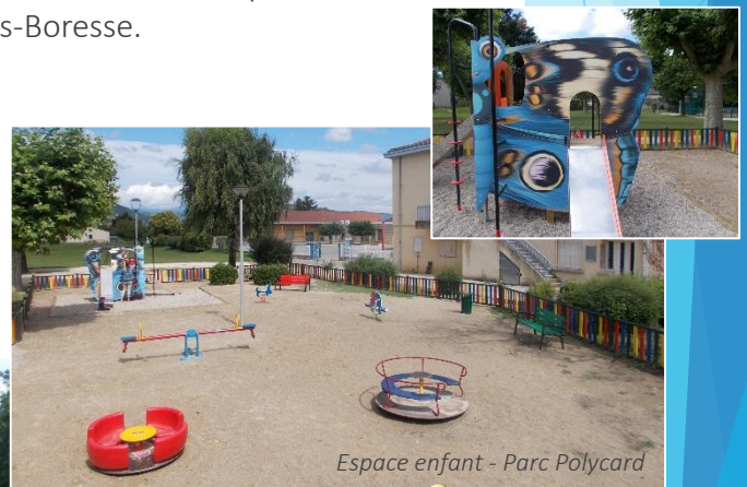
Espace enfant - Parc Polycard

Des travaux vont être entrepris en Septembre afin d'éviter une nouvelle crue du Merdarioux sur le croisement de la départementale et de la Route de Bas-Boresse.