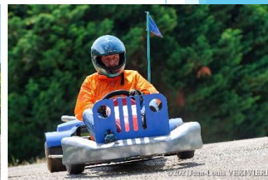
2° course de caisses à savon le 27 juin

Soirée « Vive la vie » de la Compagnie Pericard le 9 juillet dans la cour de l'école