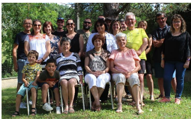
Repas de quartier de Maucune