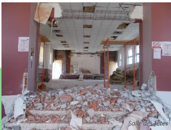
Salle des fêtes

Cependant, ils entraînent quelques difficultés d'accès notamment à l'école; ces contraintes sont aussi nécessaires pour la sécurité de tous et surtout de nos enfants. Les travaux impactent également nos associations car la maison des associations, la bibliothèque et le club du rayon d'or ne sont plus accessibles. Nos associations s'adaptent à cette situation dans la perspective de bénéficier d'une salle des fêtes plus grande, plus fonctionnelle, accessible à tous.