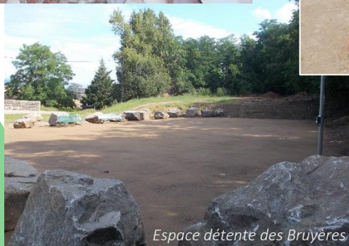
Espace détente des Bruyères