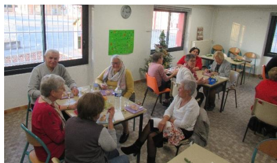
La bûche de Noël des Amis du Rayon d'Or

Horaires du secrétariat de la mairie : Lundi de 10h à 12h et de 14h à 18h – Mercredi de 8h30 à 12h – Vendredi 10h à 12h et 14h à 16h