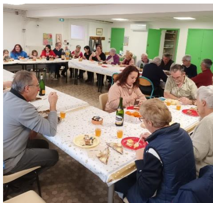
Les membres de la pétanque des bruyères autour de la buche de Noël le 28 décembre