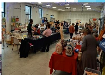
Weekend de Noël du Comité des Fêtes