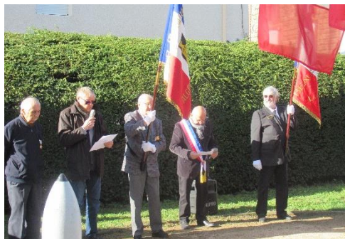
Cérémonie du 11 Novembre avec les enfants de l'école au chant