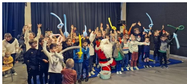
Le goûter de Noël de l'ESND