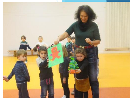
Rencontre intergénérationnelle entre les maternelles et nos aînés